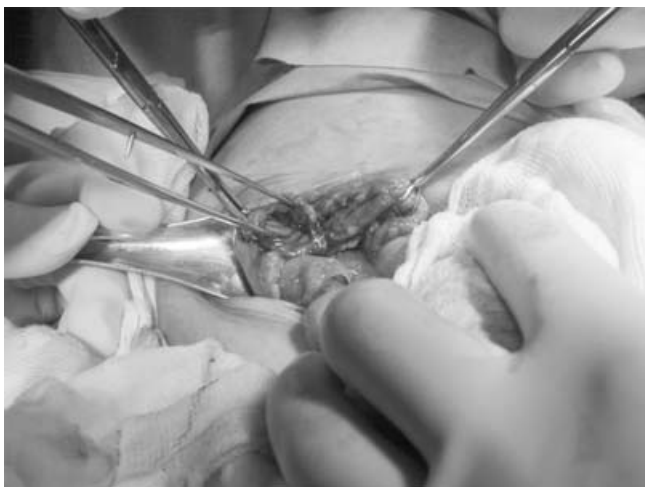
Figura 2. Transoperatorio que muestra la totalidad de la circunferencia duodenal seccionada. Hay signos evidentes de peritonitis.

impacto sobre el abdomen que aparentemente no tuvo mayor repercusión clínica, accidente que se repitió en otra ocasión días después, habiendo entonces vómito biliar, dolor abdominal intenso, mal estado general y datos de irritación peritoneal, motivo por el cual fue llevado a un hospital pediátrico del sur de la ciudad de donde se trasladó al Hospital Pediátrico Moctezuma.