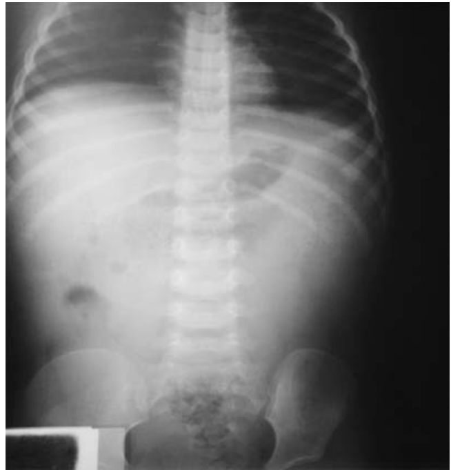
Figura 4. Estudio radiológico simple de abdomen que evidencia signos más notorios de peritonitis. La cantidad de aire es escasa y las opacidades distal y pélvica son notorias.

Por otro lado, la amplia gama de manifestaciones clínicas que se observan se debe a que la perforación del duodeno se acompaña de salida de su contenido hacia la cavidad peritoneal, lo que hace que parezca una gran quemadura dada la liberación de líquido y enzimas irritantes vertidas hacia la cavidad. 8