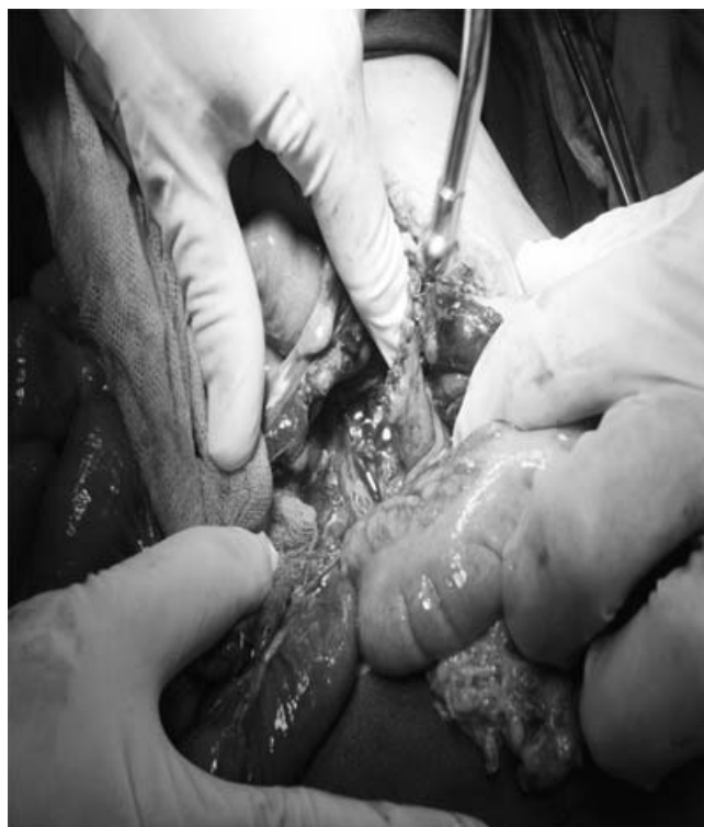
Figura 3. Construcción del muñón duodenal, nótese el grado de inflamación peritoneal.

Niña de dos años cuatro meses de edad, con antecedente de fractura supracondílea izquierda al año de edad por la que requirió tratamiento quirúrgico. Inició el padecimiento que motivó su hospitalización, según refirió la madre, posterior a