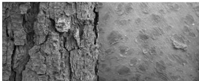
Figura 4b. Acercamiento a las escamas de la piel y el tronco de un árbol.