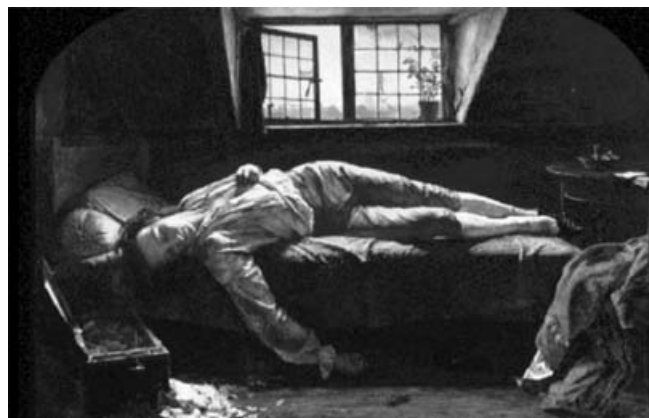
Figura 2. La muerte de Chatterton, de Henry Wallis (1856). Galería Tate, Londres.

Hipócrates, un filósofo y artista que también era médico,