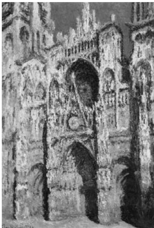
Figura 1. La catedral de Ruan de Calude Monet (1893). Museo d'Orsay, Paris.