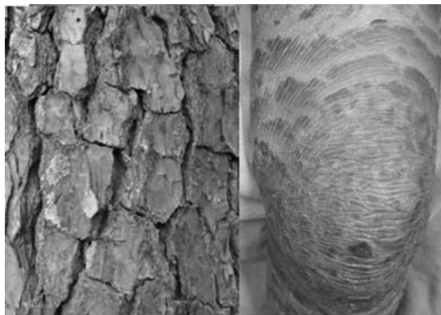
Figura 4a. El tronco de un árbol y una pierna con ictiosis.

Según Willan el método diagnóstico en la dermatología resalta la importancia de la observación clínica y es la única manera de lograr el diagnóstico correcto. Laënnec, el médico que inventó el estetoscopio en 1816 dijo: “aquel que admita que la medicina no puede existir sin la observación,