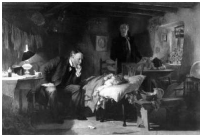
Figura 3. El Doctor , de Sir Luke Fildes (1891). Galería Tate, Londres.

La historia del kouros ejemplifica poderosamente el