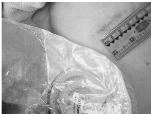
Figura 3. Paciente de 33 años con un índice de masa corporal de <math><20 \text{ kg/m}^2</math> sometida a colecistectomía con una incisión de 3 cm, que desde el posoperatorio inmediato presentó fuga de bilis por sistema de drenaje abierto.