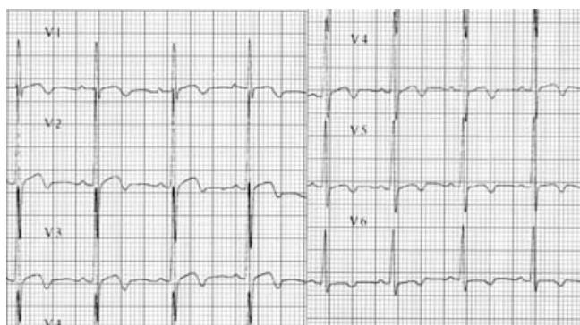
Figura 3. Electrocardiograma de reposo, derivaciones precordiales. Alteraciones inespecíficas del ST e inversión de onda T de V1 a V6.

La mutación que causa la ataxia de Friedreich es la hiperexpansión de tripletes GAA en el primer intrón; la mayor parte de los casos son homocigotos. El gen normal tiene hasta 38 repetidos de tripletes, mientras que en los pacientes con ataxia de Friedreich se presentan entre 70 y 1000. 7