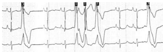
Figura 2. Tira de ritmo de estudio Holter de 24 horas. Extrasistolia ventricular aislada y en tríos.

Mujer de 21 años de edad sin antecedentes de relevancia, valorada por cuadro de siete años de evolución el cual inició con marcha inestable, sensación de desequilibrio que se exagera durante la marcha, y tropiezos frecuentes. A los dos años se agrega disminución de la fuerza en mano izquierda y torpeza de la misma, la cual evoluciona de forma insidiosa. Tres años atrás inicia con franca lateropulsión hacia izquierda y finalmente se agrega dificultad para subir escaleras. A la exploración física, signos vitales normales con exploración cardiaca normal. Exploración neurológica con disimetría ocular, optocinéticos normales. Fuerza muscular disminuida en miembros inferiores con 4+/5 proximal y 4-/5, reflejo idiomuscular presente, tono muscular normal, trofismo conservado, reflejos de estiramiento muscular en miembros torácicos proximales+ y distal 0, y en miembros inferiores proximal y distal 0. Respuesta plantar extensora bilateral, hipopalestesia en miembros inferiores con preservación a la sensibilidad al tacto, dolor y temperatura. Conserva topognosia, batiestesia, bariestesia, grafestesia y extergnosia. Romberg positivo y marcha tabética con aumento en la