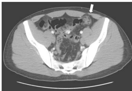
Figura 1. Tomografía computarizada con contraste endovenoso a nivel de la pelvis. En la pared anterior del colon descendente (flecha) se observa imagen hipodensa de forma ovoide, la cual muestra reforzamiento anular periférico y en su interior coeficientes de atenuación en el rango de la grasa, de 10 mm en su eje mayor, acompañada de incremento de la densidad de la grasa adyacente. La imagen corresponde al apéndice epiloico con cambios inflamatorios probablemente secundarios a torsión (apendagitis).

zamiento anular periférico y en su interior coeficientes de atenuación en el rango de la grasa de 10 mm en su eje mayor, acompañada de incremento de la densidad de la grasa adyacente; esta imagen correspondió a apéndice epiloico con cambios inflamatorios probablemente secundarios a torsión (apendagitis).