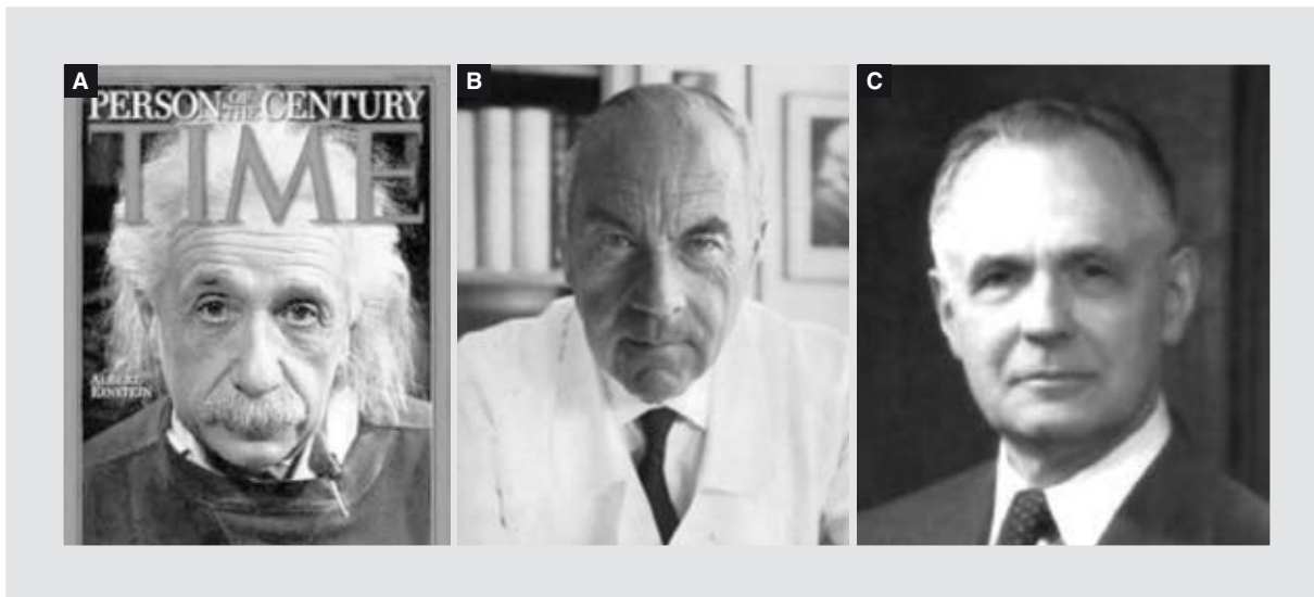
Figura 1. A: Portada de la revista Time con Einstein como «Person of the Century». B: Rudolf Nissen, se aprecia la foto de Einstein en la pared de su oficina. C: Frank Glenn, Jefe de Cirugía del Hospital de la Universidad de Nueva York.

Con el arribo de los nazis al poder y el antisemitismo rabioso del régimen, Einstein y un numeroso grupo de médicos, científicos, investigadores e intelectuales se vieron forzados a buscar trabajo en otros países.