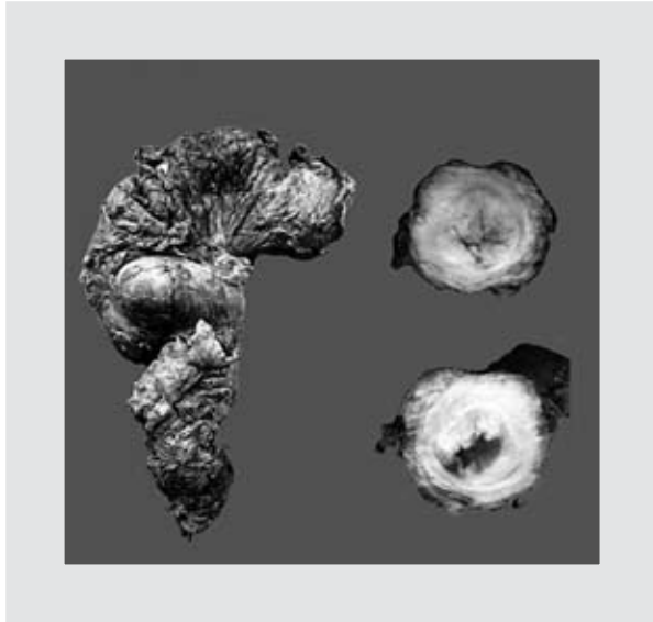
Figura 1. Espécimen quirúrgico que muestra escisión mesorrectal incompleta (izquierda) y una neoplasia exofítica infiltrando el espesor total de la pared rectal.

que permitirá restituir el tránsito intestinal, e incluso en enfermedad metastásica, permitirá paliar la obstrucción, disminuir la carga tumoral y, en su caso, la fuente de metástasis; e incluso si las metástasis son en sitios resecables dentro de la cavidad abdominal, se puede intentar en el mismo tiempo quirúrgico llevar al paciente a resección completa del tumor y metástasis (resección R0, extirpación completa de la neoplasia). Obviamente, mientras más entrenamiento tenga el cirujano, y especialmente si es un cirujano oncólogo, mejor será el pronóstico del paciente y mayor la probabilidad de llevarlo a resección R0. En conclusión, el manejo del paciente del caso clínico fue adecuado, pues permitió aliviar la obstrucción intestinal y debulking ; desafortunadamente, el paciente quedó con neoplasia residual microscópica (R1) en el margen circunferencial; esto ocurre hasta en un 20% de las resecciones anteriores bajas y es el principal predictor de recurrencia y supervivencia.