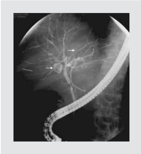
Figura 2. Colangiopancreatografía retrógrada endoscópica. Colangiopancreatografía retrógrada endoscópica que muestra un quiste de la vía biliar que depende del conducto hepático derecho (flecha), además de una apariencia arrosariada del resto de la vía biliar intrahepática, con presencia de zonas de estenosis y otras de dilatación (flecha).

paciente continuó con episodios recurrentes de colangitis, por lo que se realizó resección quirúrgica del quiste en conjunto con los segmentos hepáticos VI y VII; el reporte anatomopatológico corroboró la presencia de un quiste simple de la vía biliar y de cirrosis con actividad moderada. La paciente presentó una adecuada evolución, y actualmente tiene cirrosis hepática Child B (8 puntos) con un puntaje model for end liver disease (MELD) de 12.