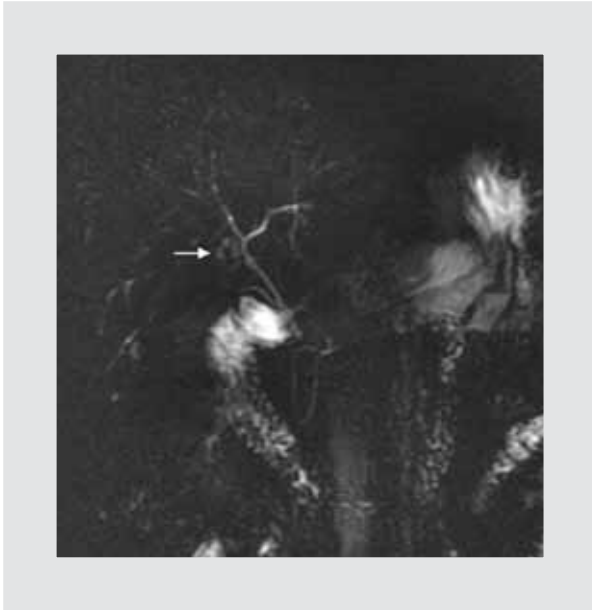
Figura 1. Colangiorrsonancia magnética nuclear. Colangiorrsonancia magnética nuclear que muestra una dilatación quística del conducto hepático derecho (flecha). El resto de la vía biliar, de aspecto hiperintenso, muestra zonas de adelgazamiento intercaladas con áreas de mayor diámetro.

una causa secundaria, en conjunto con una colangiografía compatible 1 . Inicialmente solo la fosfatasa alcalina está elevada; en estadios avanzados, se agrega hiperbilirrubinemia 2 . A pesar de que el hallazgo imagenológico más usual es el de un patrón arrosariado de la vía biliar, hasta el 25% de los casos puede tener dilataciones quísticas de la vía biliar 3,4 . El estándar de oro para el diagnóstico imagenológico de la CEP es la colangiopancreatografía retrógrada endoscópica (CPRE), sin embargo, la visualización de la vía biliar intrahepática periférica puede ser mejor con la colangiorrsonancia magnética nuclear (CRM) 5,6 . La CEP conlleva un riesgo incrementado de colangiocarcinoma y de carcinoma hepatocelular; además, se asocia a enfermedad inflamatoria intestinal (EII), principalmente de tipo colitis ulcerosa crónica inespecífica hasta en el 70% de los casos. No existe al momento un tratamiento médico que haya demostrado ser efectivo y modificar la historia natural de la enfermedad; la única opción curativa es el trasplante hepático 7 .