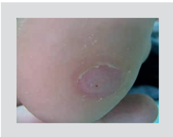
Figura 5. Aspecto una vez que el tejido ha epitelizado tres semanas después de la aplicación de la preparación.

La duración promedio de las lesiones fue de 26.53 \pm 2.36 meses. Todos los pacientes recibieron tratamientos previos (Tabla 1). La respuesta al tratamiento