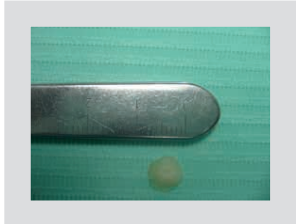
Figura 4. Aspecto de la verruga plantar recalcitrante eliminada en una visión plantar.

El resultado consistió en la eliminación y la limpieza total de la lesión (Figs. 3 y 4). El tratamiento ambulatorio posterior estaba fundamentado en la aplicación tópica de antisépticos, agentes cicatrizantes o pomadas antibióticas para evitar la infección de la lesión, y el empleo de un vendaje de protección posterior.