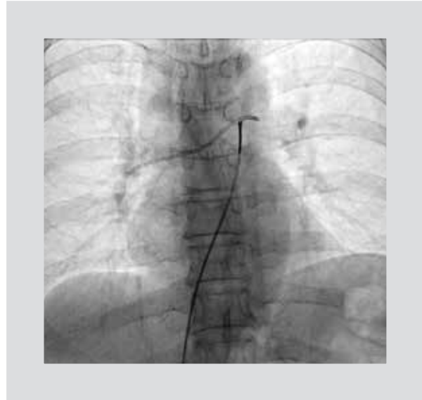
Figura 2. Imagen fluoroscópica de la fijación del fragmento del catéter con el catéter lazo.

arteria pulmonar; los estudios diagnósticos tipo cateterismo cardíaco, arteriografía, angioplastia, biopsias y manejo de procedimientos terapéuticos por radiología intervencionista, como embolizaciones selectivas, biopsias e instalación de shunt porto-sistémico tipo TIPS, a nivel hepático.