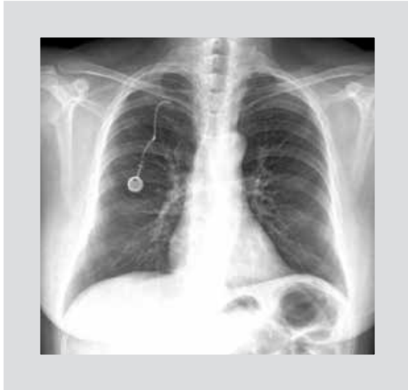
Figura 1. Radiografía de tórax posteroanterior en la que se observa el catéter ocupando las ramas pulmonares derecha, izquierda y el tronco pulmonar.