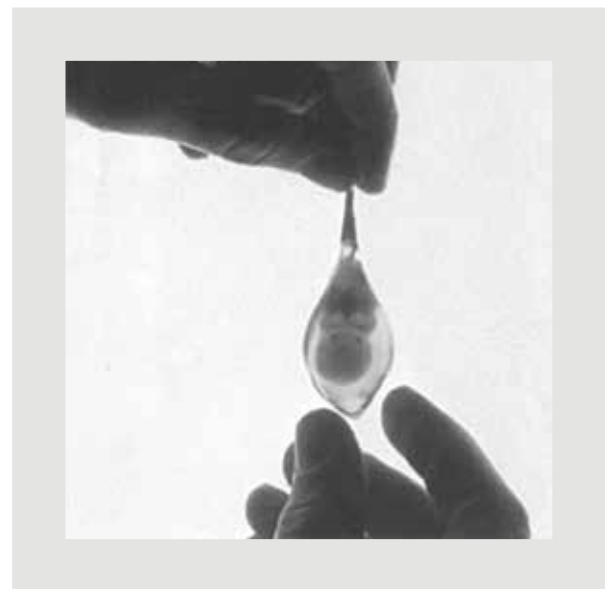
Figura 1. Esta extraordinaria fotografía de un embrión en su saco amniótico intacto la tomó, tras una cirugía que fue requerida debido a un embarazo ectópico (en la trompa de Falopio), el médico y fotógrafo Robert Wolfe en la Universidad de Minnesota, EE.UU., en 1972.