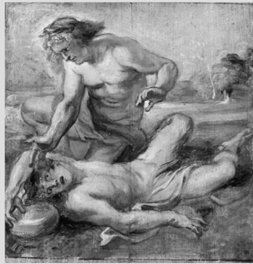
Figura 4. Peter Paul Rubens (1577-1640). La muerte de Jacinto, 1636-7. Óleo sobre tabla, 14.5 x 13.6 cm. Museo del Prado, Madrid.

Nauplio de Eubea representa al piretro (o pelitre) 20 , cuyo nombre alude al fuego por causar irritación cutánea al contacto 33 . Escribió el Apolodoro de Frazer al respecto de esta alusión: «But afterwards, when he [Nauplio] learned that the Greeks were on their way home to their native countries, he kindled the beacon fire on Mount Caphereus, which is now called Xylophagus; and there the Greeks, standing in shore in the belief that it was a harbor, were cast away» 34 . El juego