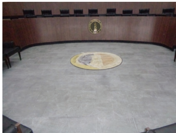
Figura 10. Medallón de bronce fundido con el emblema de la Academia Nacional de Medicina de México, diseñado por el maestro Pedro Ponsanelli.

Se colocó también una placa de bronce con el nombre de la ANMM a la entrada del vestíbulo, protegida por una estructura de acero y cristal e iluminada mediante un tubo de luz regulado por una fotocelda. Se redistribuyeron los seis bustos que ya existían en el vestíbulo y se agregaron cuatro más que se tenían en bodega o se encontraban en el segundo piso del