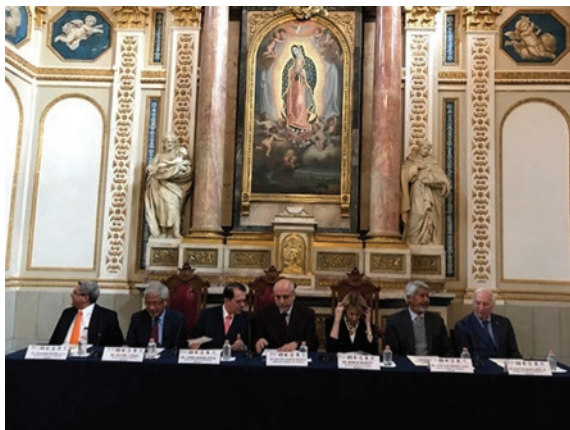
Figura 5. Segunda reunión entre el Consejo de Academias Nacionales de los Estados Unidos de Norteamérica y el Consejo de Academias Nacionales de México, celebrada el 15 de febrero de 2018 en el Palacio de Minería de la Ciudad de México.