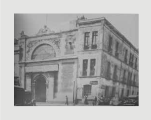
Figura 2. Ex convento y hospital de Betlemitas, sede de la primera Academia de Medicina de México en 1836.

por Leopoldo Río de la Loza, médico, farmacéuta y especialista en química. El órgano publicitario fue el Periódico de la Academia de Medicina de México , cuyo único número salió en 1852. Unos años después, se publicó la Unión Médica de México . El hecho de que Río de la Loza ofreciera su casa para las reuniones de la Academia denota el interés del gremio médico por conocer las innovaciones y difundir lo propio. Sin embargo, después de siete años de reuniones, la Academia se extinguió 2 (Figs. 3 y 4).