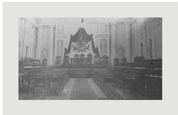
Figura 5. Salón de Actos de la Escuela de Minas, sede de la Comisión Científica, Literaria y Artística de México en 1864.

La Comisión Científica estuvo conformada por varias agrupaciones o secciones, entre ellas la sexta, denominada Ciencias Médicas, que se reunió por primera