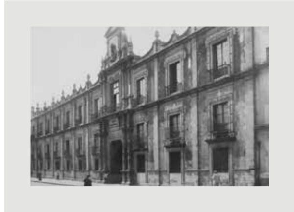
Figura 7. Museo Nacional, ubicado en la calle de Moneda del Centro de la ciudad de México, sede de la Sección Médica de la Comisión Científica, 1864.