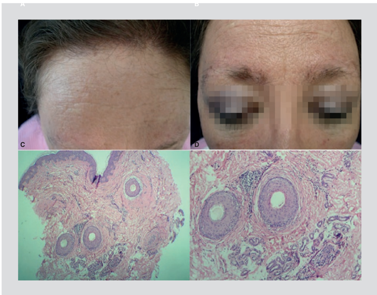
Figura 3. A: retroceso de la línea de implantación del pelo frontal. B: alopecia difusa de las cejas desde su tercio medio. C y D: corte horizontal. Capa córnea laminar. Focos de fibrosis abundante en el espesor de la dermis y escasos infiltrados linfocitarios perivasculares. Hematoxilina/Eosina.