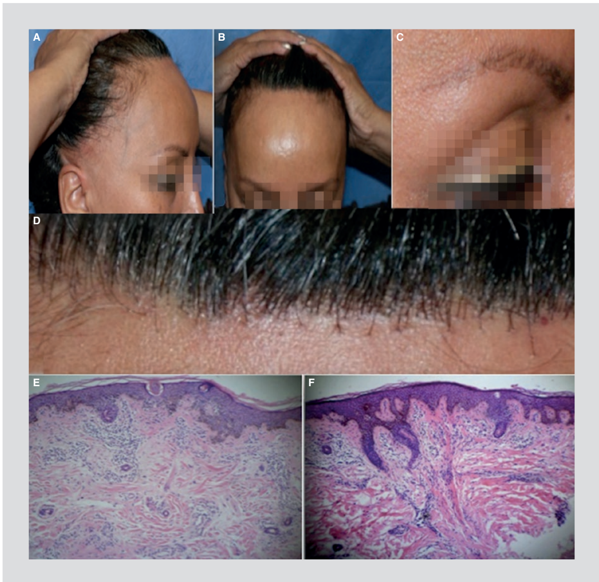
Figura 1. A: retroceso de la línea de implantación frontotemporal. B: vista lateral. C: alopecia difusa de las cejas. D: alopecia cicatrizal en banda. E y F: acantosis irregular con focos de fibrosis en todo el espesor de la dermis, así como moderados infiltrados linfocitarios perivasculares. Hematoxilina/Eosina.

con 355 pacientes con diagnóstico de AFF, de los cuales 343 correspondieron al sexo femenino y solamente 12 al masculino. La edad promedio reportada fue de 61 años, con un rango de entre 23 y 86 4 . Las zonas geográficas con mayor número de casos se encuentran en Europa Central y Norteamérica, con una baja incidencia en los países asiáticos 5 . De manera característica, esta dermatosis tiene una presentación en mujeres posmenopáusicas, aunque existen reportes de casos en la literatura en mujeres premenopáusicas (16%) 4,6 . Los casos en el sexo masculino son extraordinarios 7,8 . El aumento reciente del número de