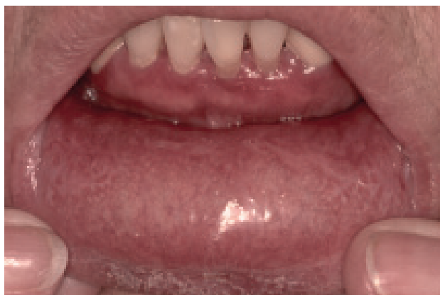
Figura 3. Lesión liquenoide en mucosa asociada a beta bloqueadores.