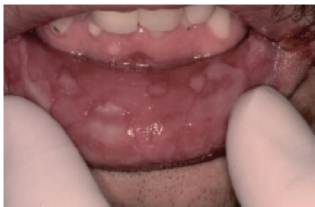
Figura 1. Eritema multiforme. Lesiones erosivas labiales cubiertas por membrana serohemática.

(cuadro V). El mecanismo exacto por el cual se producen estas reacciones se desconoce, y no existen criterios clínicos o histopatológicos confiables para diferenciar estas lesiones del liquen plano, por lo que el medio mas confiable para establecer el diagnóstico de una reacción liquenoide es confirmar la resolución de la misma después de elimi-