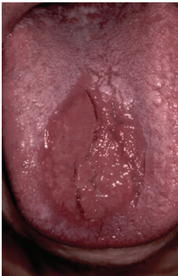
Figura 2. Eritema pigmentado fijo por medicamentos. Erosión simétrica en mucosa lingual.

A partir de la observación de que los antimaláricos utilizados durante la segunda guerra mundial causaban lesiones liquenoides (cambios clínicos e histopatológicos similares al liquen plano), numerosos fármacos, entre los que destacan los medicamentos AINEs, inhibidores de la ECA e hipoglucemiantes bucales se han visto asociados al desarrollo de este efecto adverso (figura 3). Otros medicamentos causantes de estas lesiones incluyen a los inhibidores de proteasas, medicamentos antihipertensivos, fenotiazidas, antimaláricos, sulfonamidas, tetraciclinas, diuréticos, tiazidas, anticonceptivos orales y muchos mas